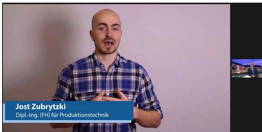
Abb. 2: Bild aus „Elevator Pitches“

Pressekontakt Institut für Holztechnologie Dresden gemeinnützige GmbH Anja Sommer Tel. +49 351 4662 223 Fax +49 351 4662 211 E-Mail anja.sommer@ihd-dresden.de