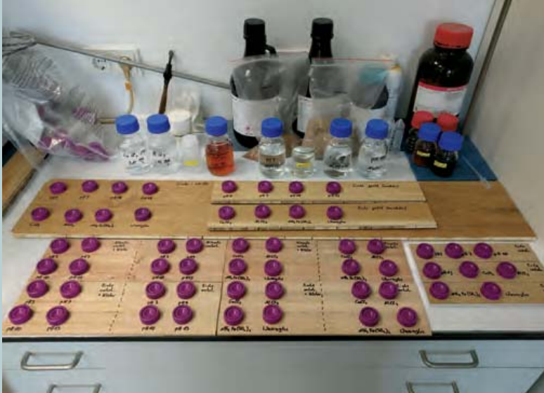
Abb. 2: Screening der chemischen Resistenz

Fig. 2: Screening of the chemical resistance