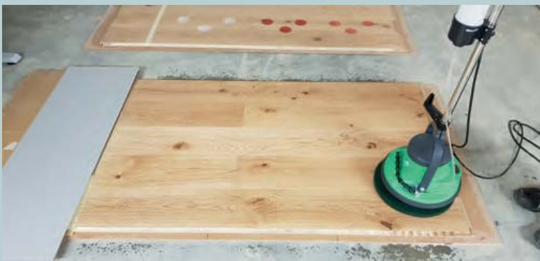
Abb. 3: Reinigungsversuche

Fig. 2: Screening of the chemical resistance