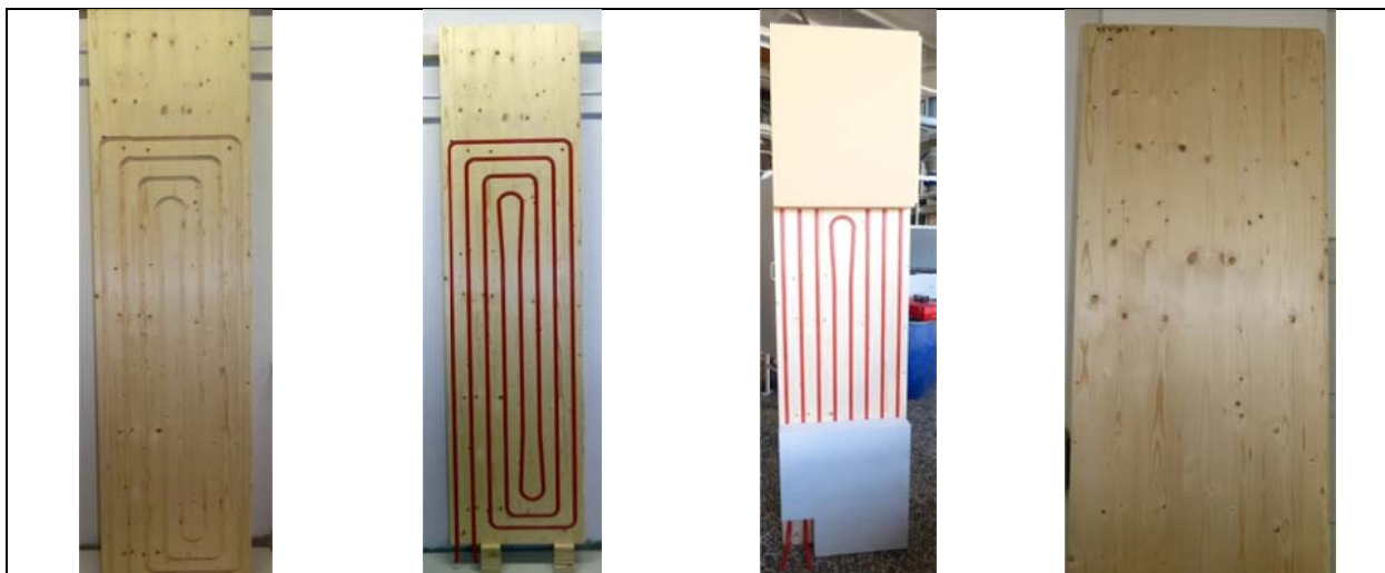
Abb. 2: Gefertigtes Element mit spiralförmiger Rohrverlegung, Größe 2,5 m x 0,62 m, Rohrabstand 8 cm, auf der wandzugewandten Seite mit aufgebrachter Dämmung und Ausschnitt in Mitte zur Darstellung der Verrohrung; (links: eingefräste Kanäle; 2. von links: mit eingelegten Rohren; 2. von rechts: fertiges Element mit Dämmung; rechts: raumzugewandte Seite)